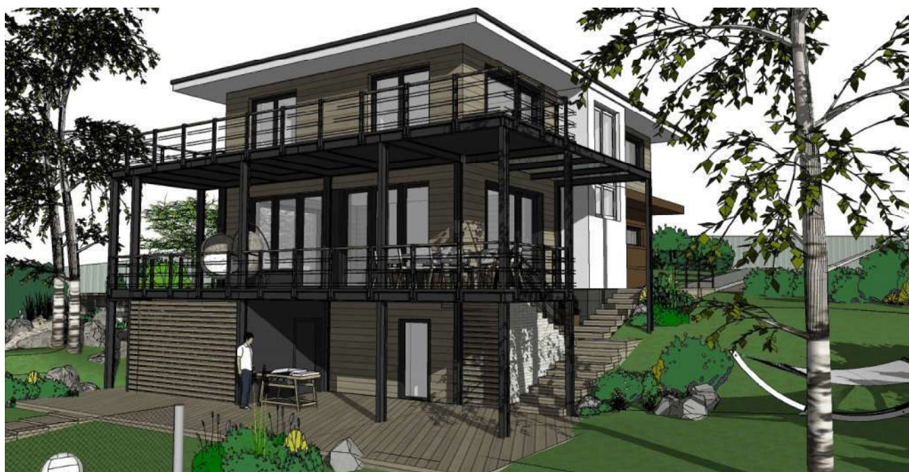
Общий вид 1: